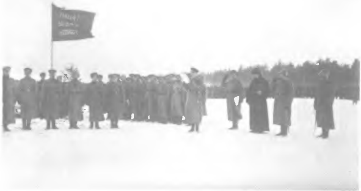
После февраля. Определенно первые недели: все еще одеты с иголочки, порядок безукоризненный. Скоро все это лопнет...