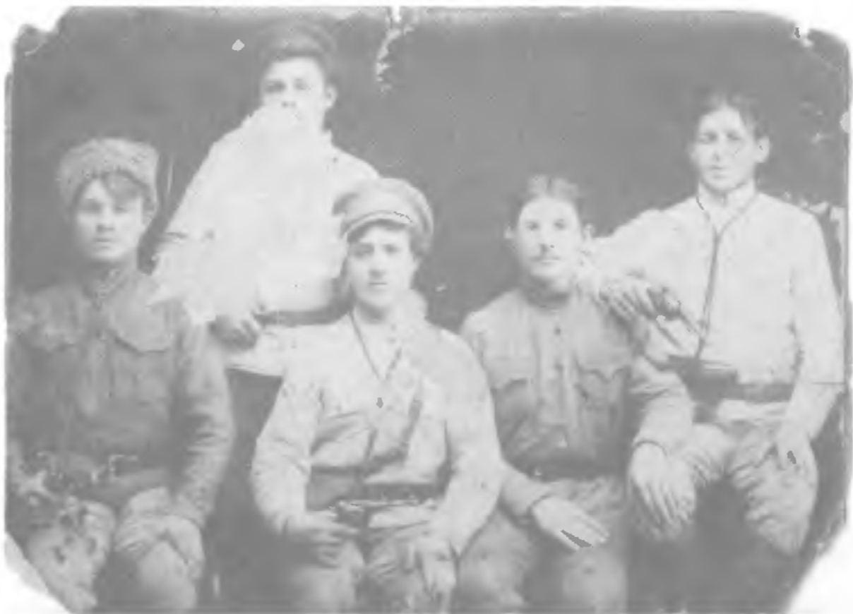
Сибирь. Те, кого позднее стали называть «белобандитами». На самом деле скорее — деревенские ухари, обрадовавшиеся возможности погулять вдоволь, коли уж все вокруг рушится и пылает