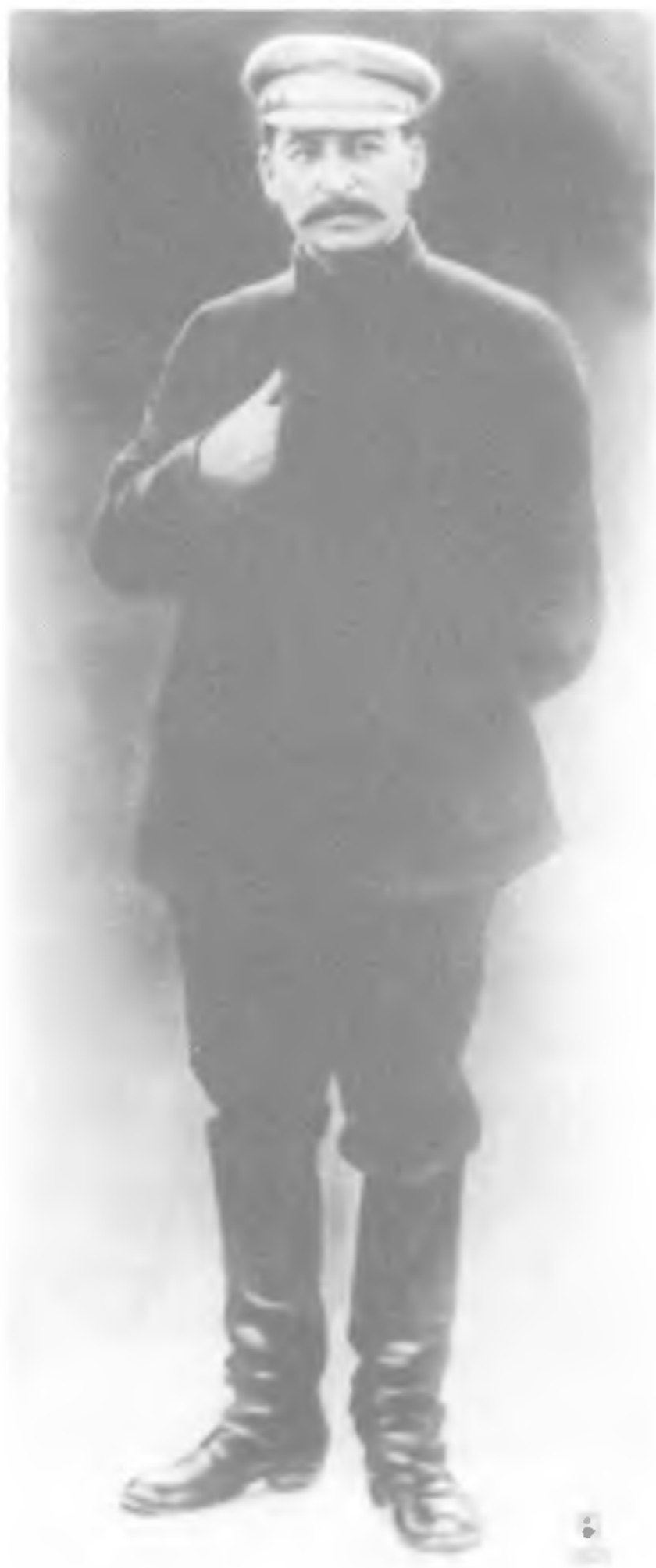
Сталин в 1930 г.