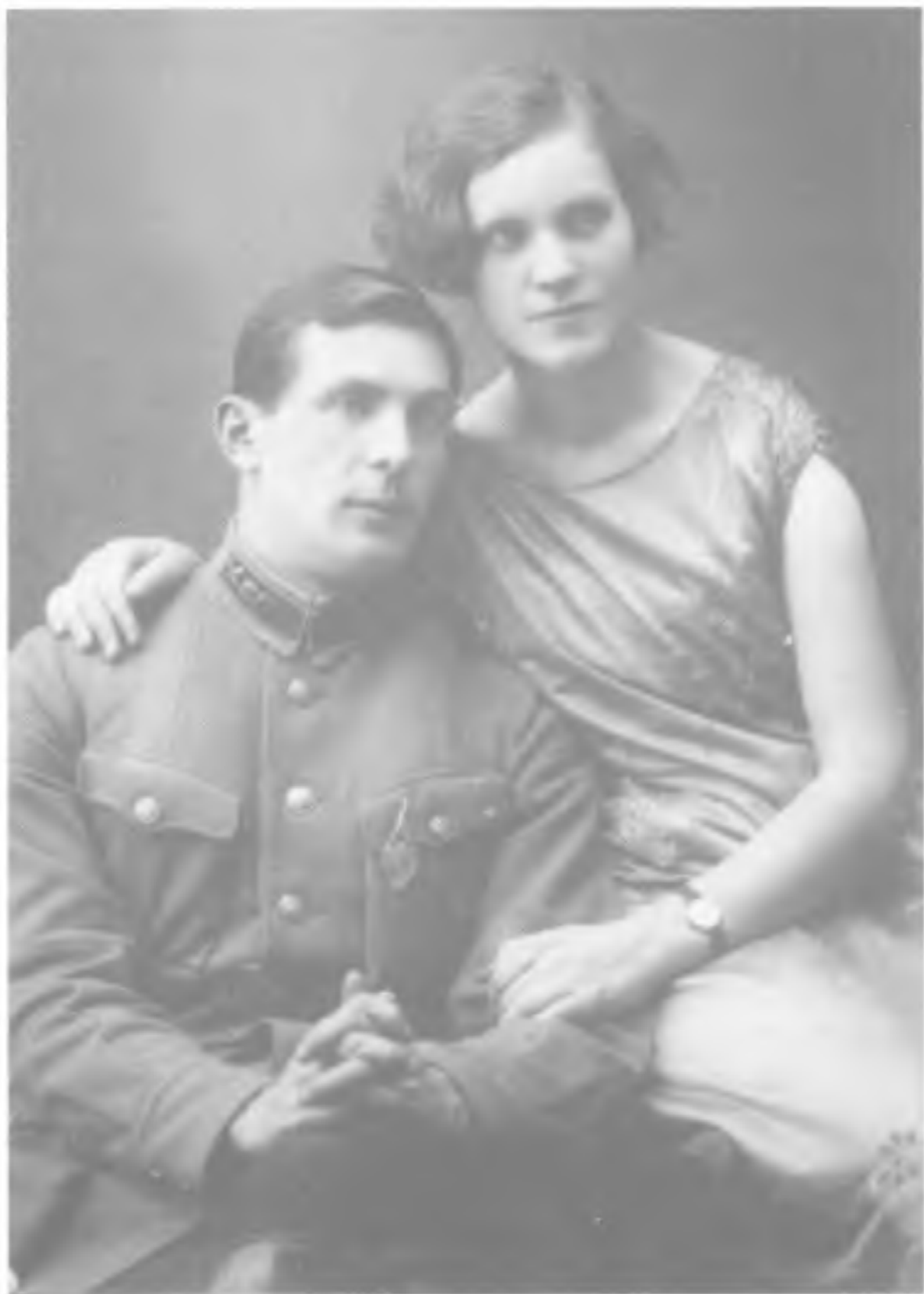
Сотрудник администрации одного из сибирских лагерей