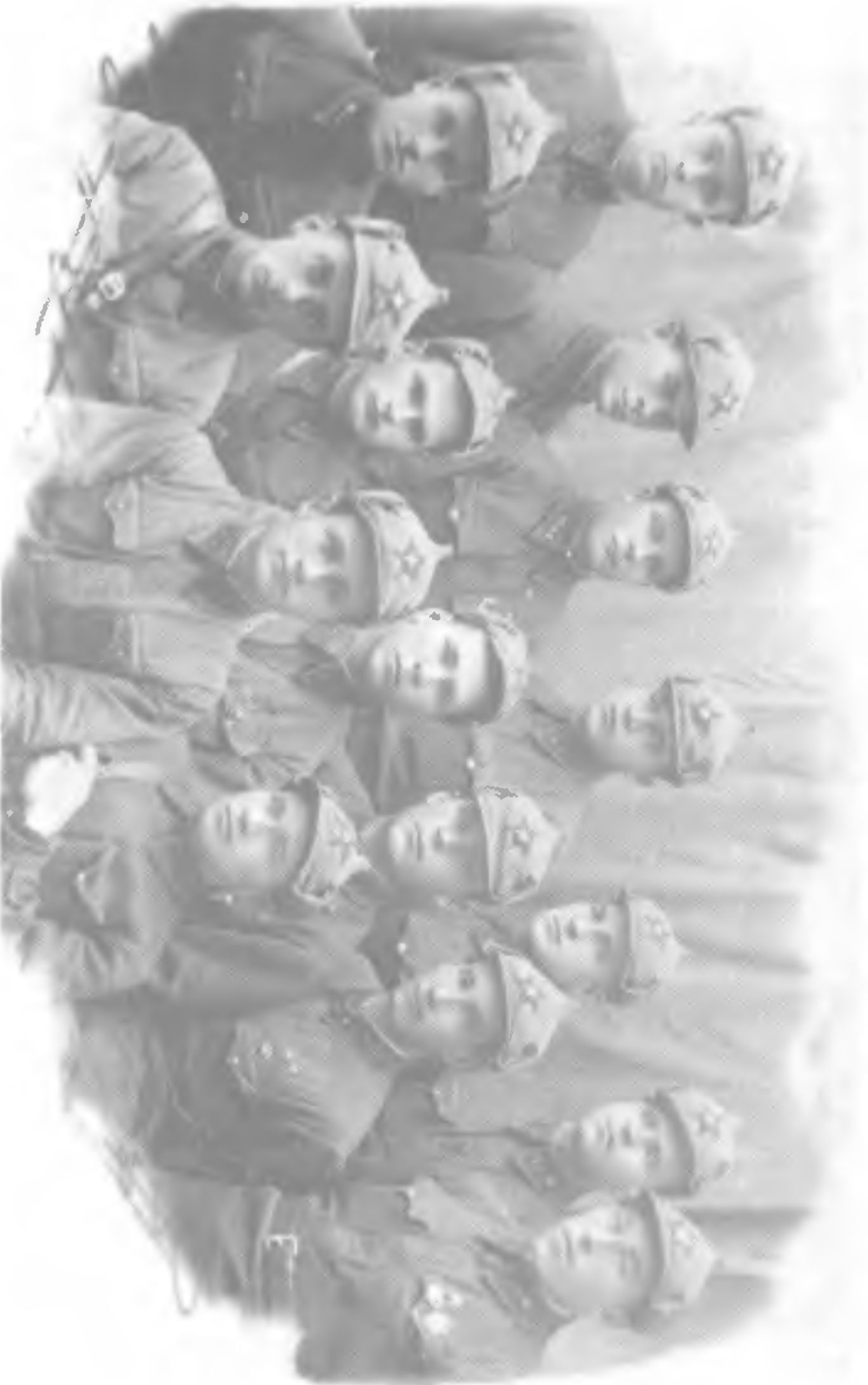
Младшие командиры Красной Армии (30-е гг.)