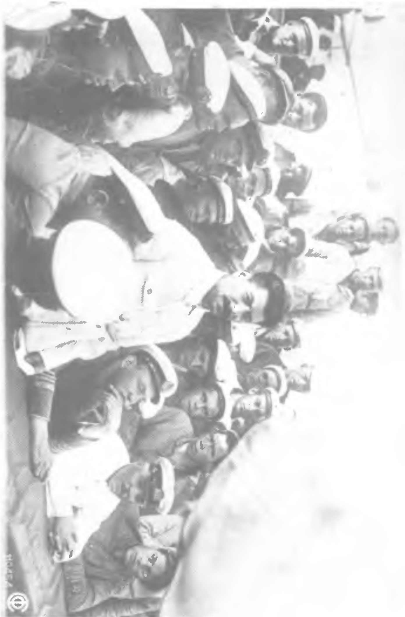
Сталин среди краснофлотцев