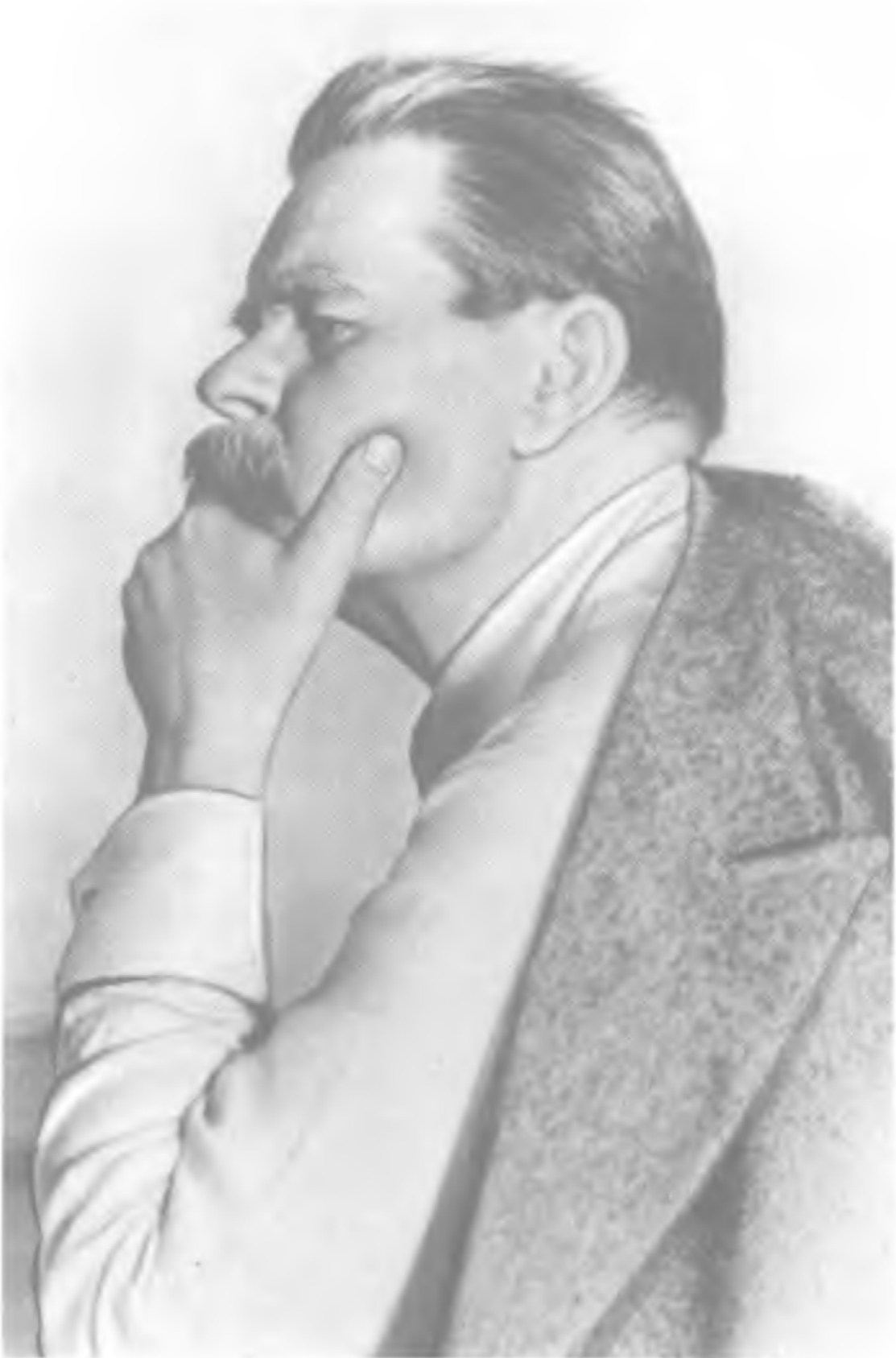
Один из последних снимков Максима Горького