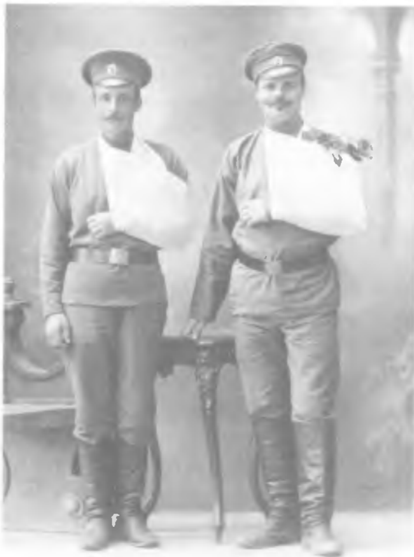
Первая мировая. Выздоровляющиеся в госпитале