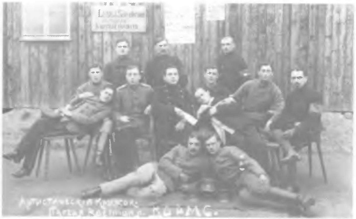
Русские офицеры в германском плену, члены театрального кружка. Война еще носила некоторый оттенок джентльменства и рыцарственности — последняя такая война в XX столетии...