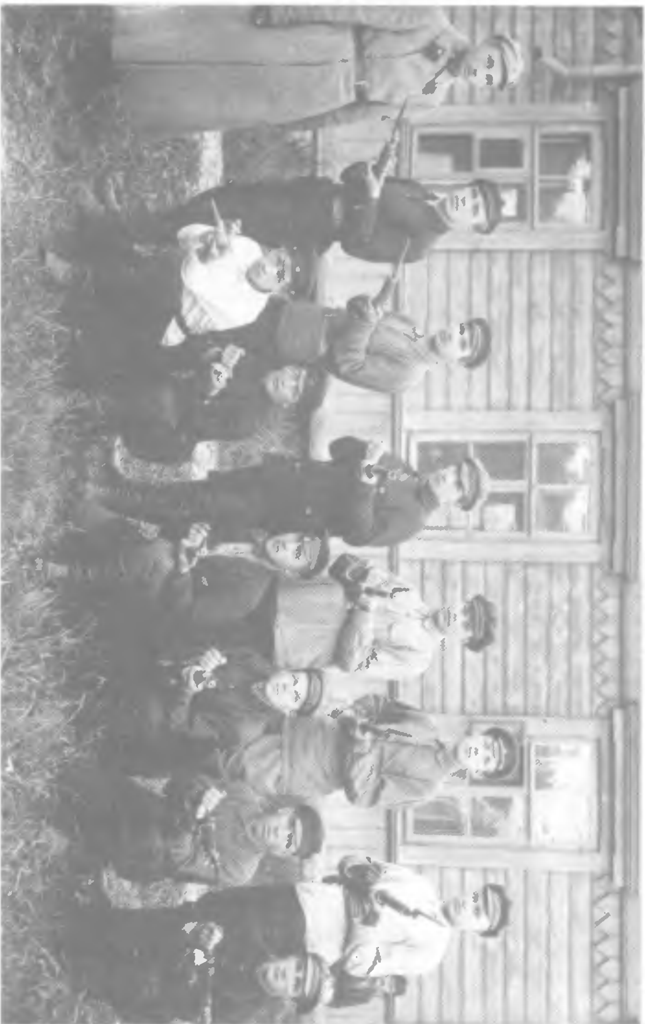
Группа чиновников (Сибирь)