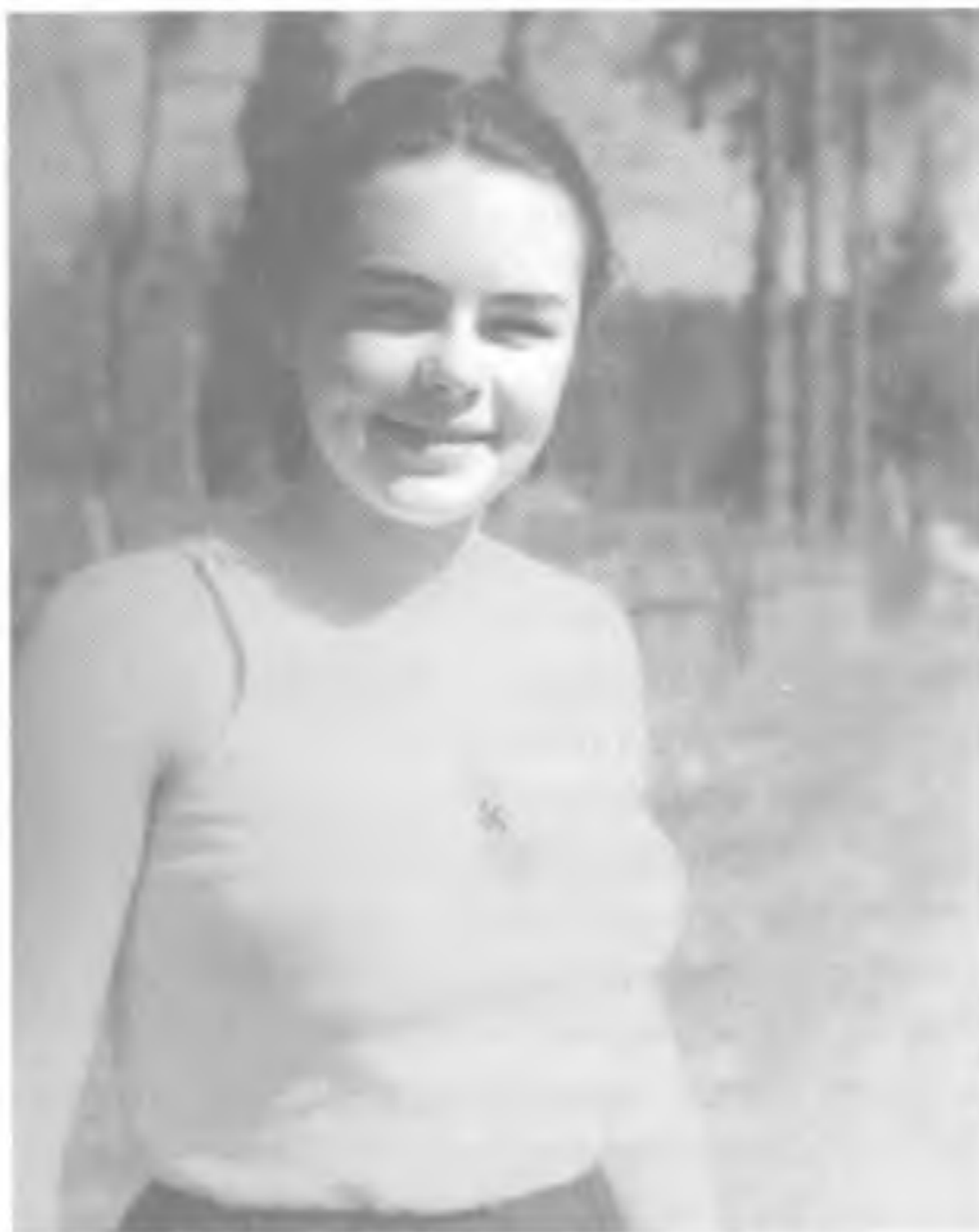
Девочка из Гитлерюгенд