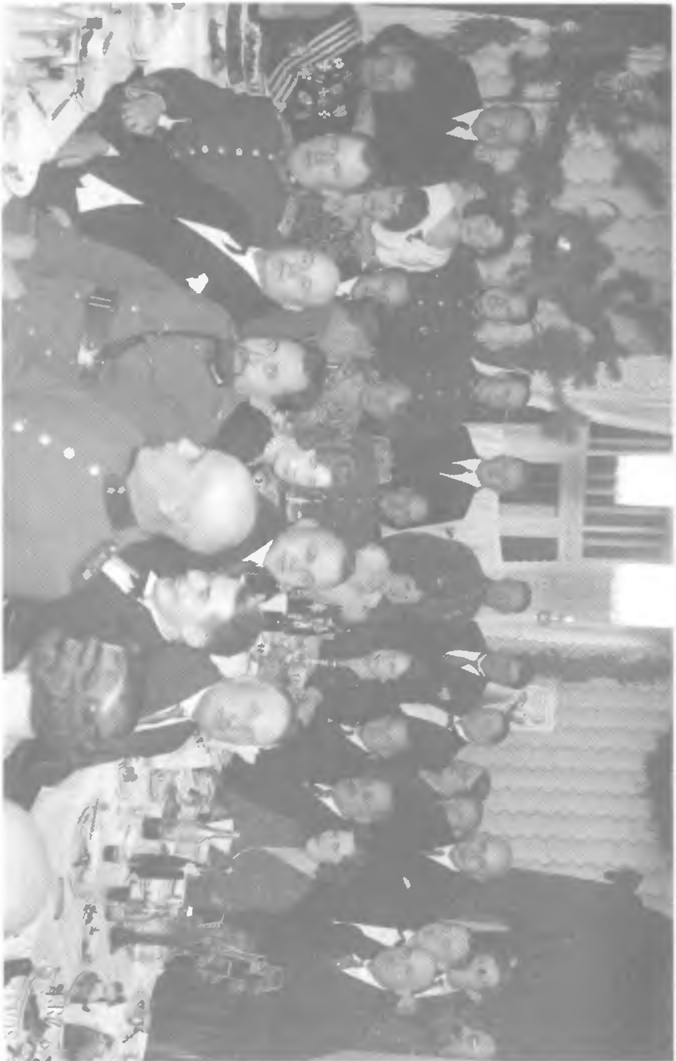
Совещание разведчиков и военных: Прибалтика, Чехословакия, Венгрия. Пыжились, как больше... А толку?